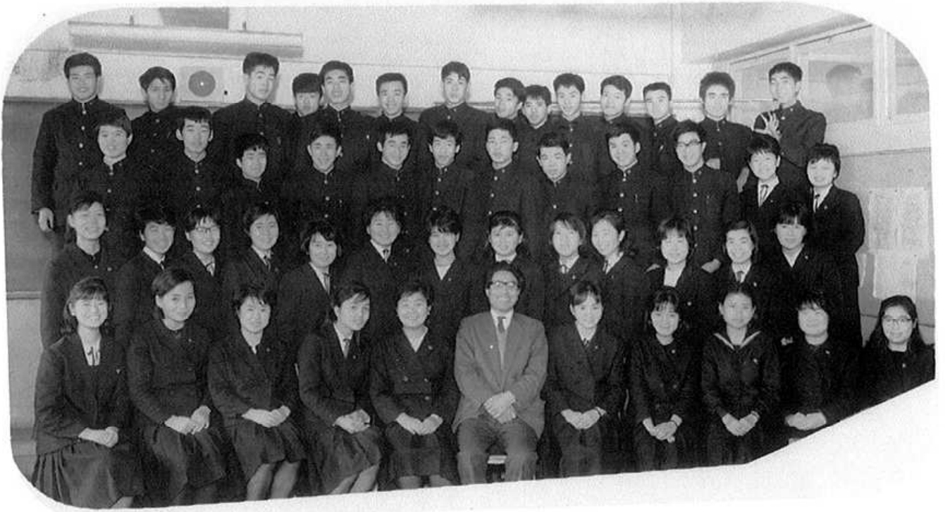
46年前の美少女、少年、まぶしいですね、恐ろしいですね、怖いですね?!